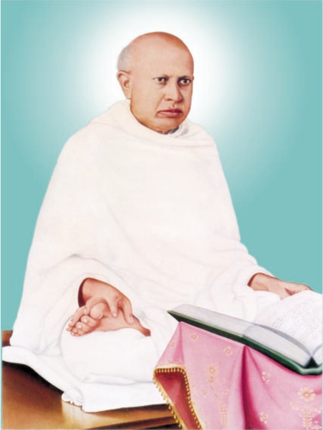
परम पूज्य अध्यात्ममूर्ति सद्गुरुदेव श्री कानजुस्वामी