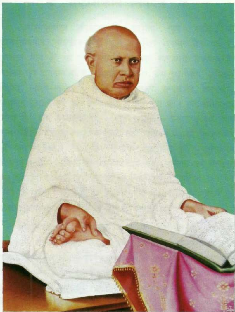
परम पूज्य अध्यात्ममूर्ति सद्गुरुदेव श्री कान्छुस्वामी