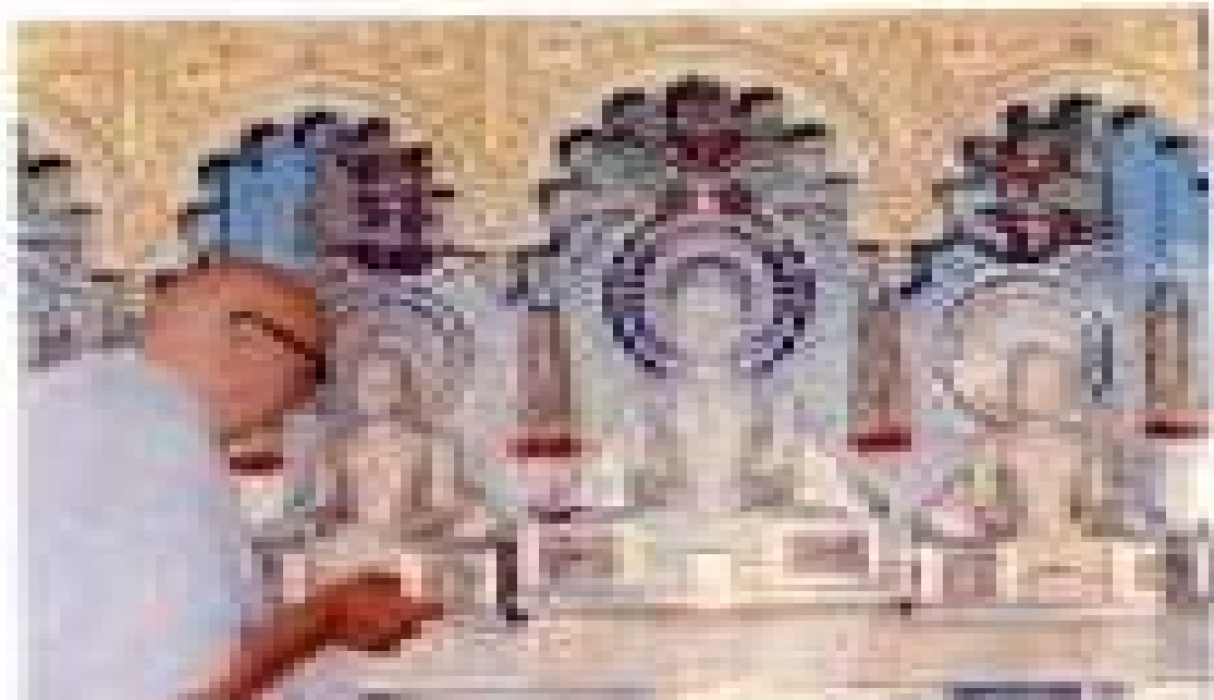
Dr. [Name] is working on a project related to [Topic].