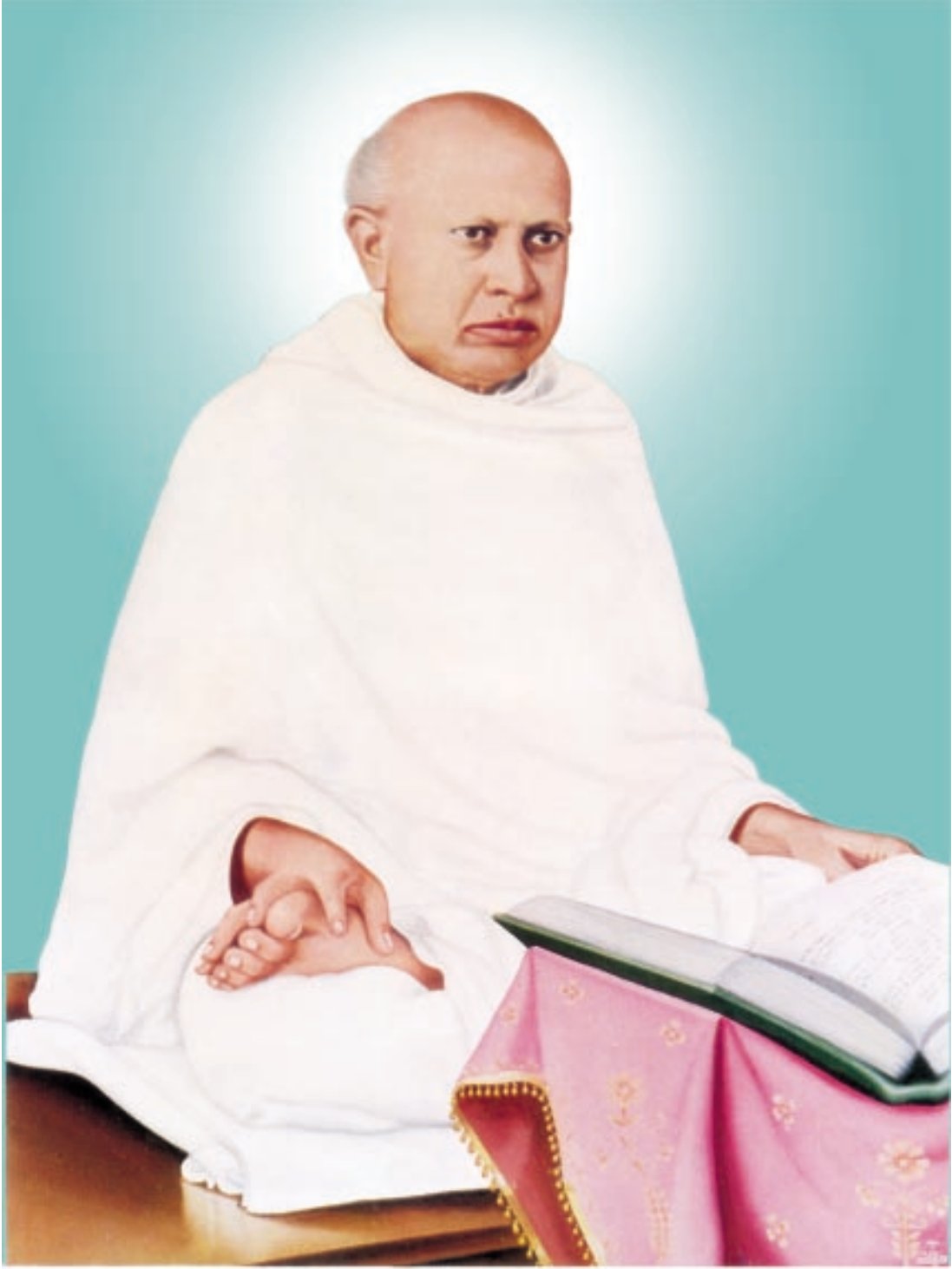
परम पूज्य अध्यात्ममूर्ति सद्गुरुदेव श्री कान्जुस्वामी